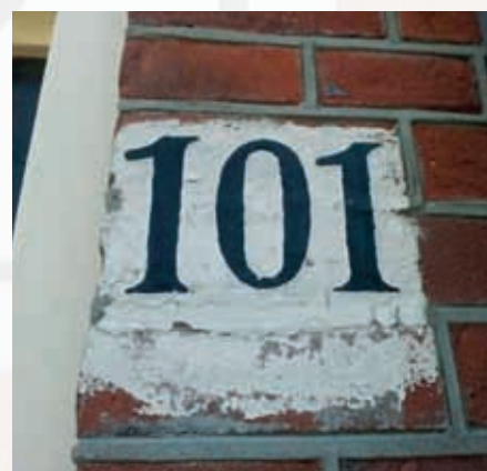
Een voorbeeld van een handgeschilderd huisnummer

Artikel 5 uit de verordening van 1878 meldt het volgende: 'De huizen en alle anderen gebouwen worden, voor elke wijk afzonderlijk, met de wijkletter en een doorlopend nummer gemerkt. De letters en nummers worden gesteld in zwarte olieverf, ter grootte van drie en een halve centimeter, op den hoofdingang van elk gebouw. De nummering geschiedt voor de eerste maal zoo ook wanneer het gemeentebestuur een nieuwe algemene nummering gelast, ten koste der gemeente.'