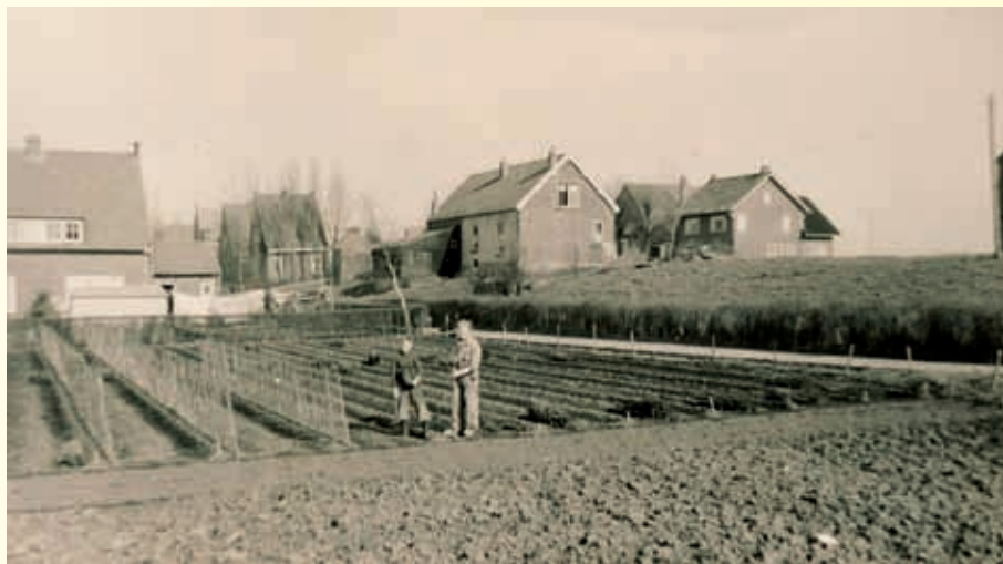
De akker achter het huis aan het Westeinde. De foto is in 1963 gemaakt vanaf het huidige Pastoor Onelplein. In 1966 werden er huizen gebouwd.

“Al met al leverden die locaties een behoorlijke oogst op, die na te zijn gedroogd van het land werd gehaald.