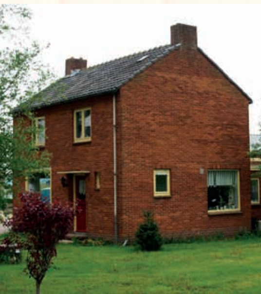
Een voorbeeld van een Terlingenwoning.