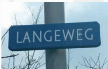
Deze straatnaam bestaat dus al van vòòr 1600.

Het woord 'straat' komt van het Latijnse 'Via Strata' en betekent: verharde weg. In de meeste dorpen en steden had je vroeger vier soorten straatnamen. Er waren straten die genoemd werden naar een kenmerk van die straat, zoals Langeweg. Straten die verband hielden met de richting waar ze naar toe liepen, zoals Kerkpad. Straten die sloegen op de handel en beroepen van de bewoners van die straat, zoals Vismarkt en Leerlooiersgracht. Straten die verwezen naar iets bijzonders of iets historisch in die straat of naar de ligging in de buurt, zoals Zuidschans en Noordschans in Oude Wetering. Tijdens het beleg van Leiden hadden de Spanjaarden te Oude Wetering twee schansen gebouwd, een in het zuiden en een in het noorden. Op basis van dit historische feit is in 1984 gekozen voor de naam Zuidschans en in 1989 voor Noordschans. In veel plaatsen kent men tegenwoordig schilderswijken , zoals Rembrandt van Rhijsingel, Jan Tooroplaan, botenwijken , zoals Praam en Schouw, burgemeesterswijken en oranjebuurten .