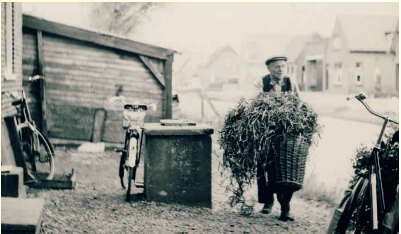
Kobus van der Meer met een mand vol plantenresten, voor zijn huis aan het Westeinde.

Om al die klanten tevreden te stellen, moest een grote voorraad zaden worden aangelegd. En daarvoor had hij