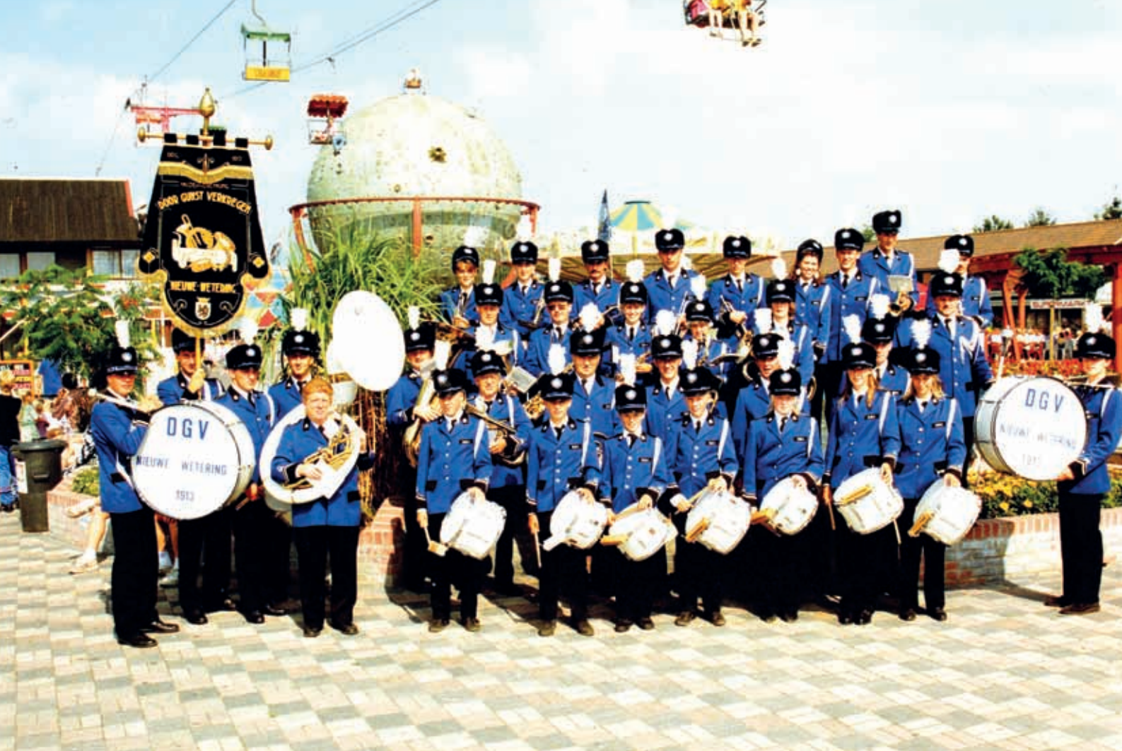
Het concours in Ponypark Slagharen.