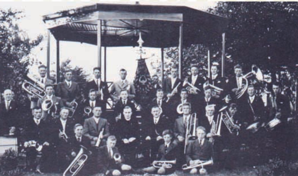
Liefde voor Harmonie in 1913.