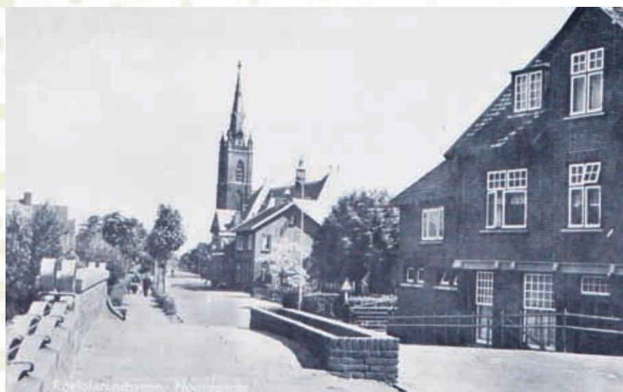
De Veilingbrug met rechts Café Wagenaar.

Om de hierboven gesignaleerde problemen echt aan te pakken startte in 1956 een grote ruilverkaveling in Alkemade waardoor tuinders hun 'losse' stukken grond ruilden en ze gingen beschikken over aaneengesloten stukken grond. Het areaal aan tuinbouwgrond werd uitgebreid. Daarop kwamen moderne tuinbouwbedrijven tot stand met verwarmde kassen en andere voorzieningen die een gevarieerde bloemeteelt mogelijk maakten. Ons bedrijf aan het Noordeinde werd in 1964 verplaatst en aan de Galgekade aan het Braassemmermeer voortgezet.