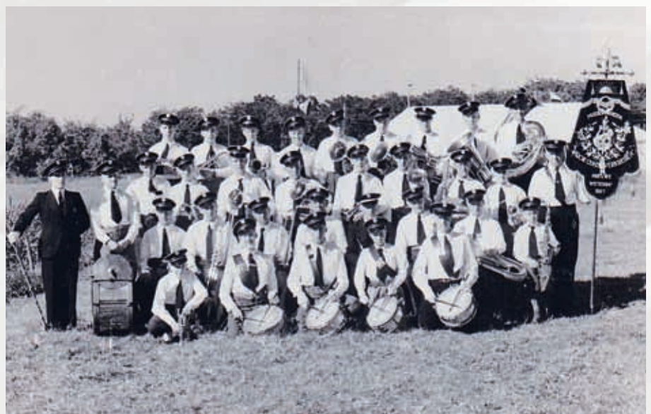
Het concours in IJsselstein in 1949.