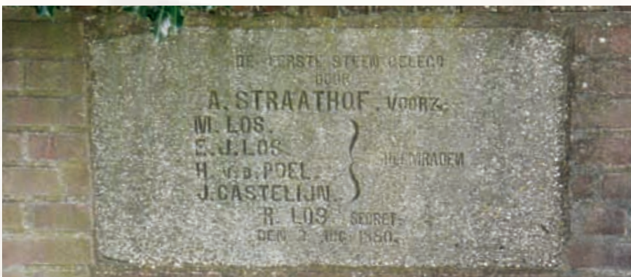
De eerste steen uit 1880.