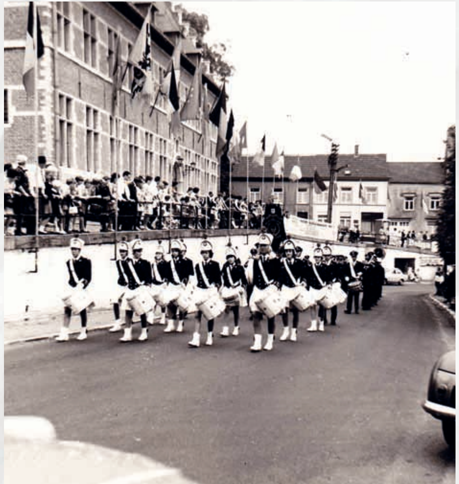
Op concours in België.

Ieder jaar zijn er natuurlijk de voorjaarsconcerten, serenades, kermisoptochten, intocht van Sinterklaas, braderieoptredens etcetera. Op 7 juni jl.