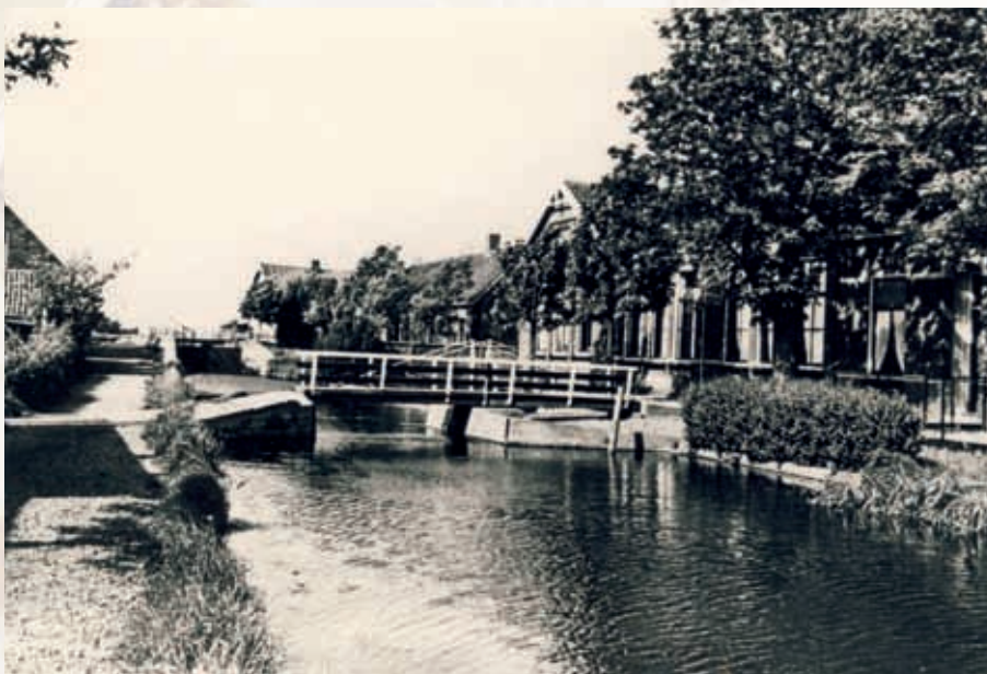
Een van de vele bruggen over de wetering en in de verte het sluisje.

In ons huis was geen wc. In de asschuur naast ons huis was een plee waar de halve buurt gebruik van maakte. De plee bestond uit een paar muurtjes van steen. De bril was van hout waarop re-