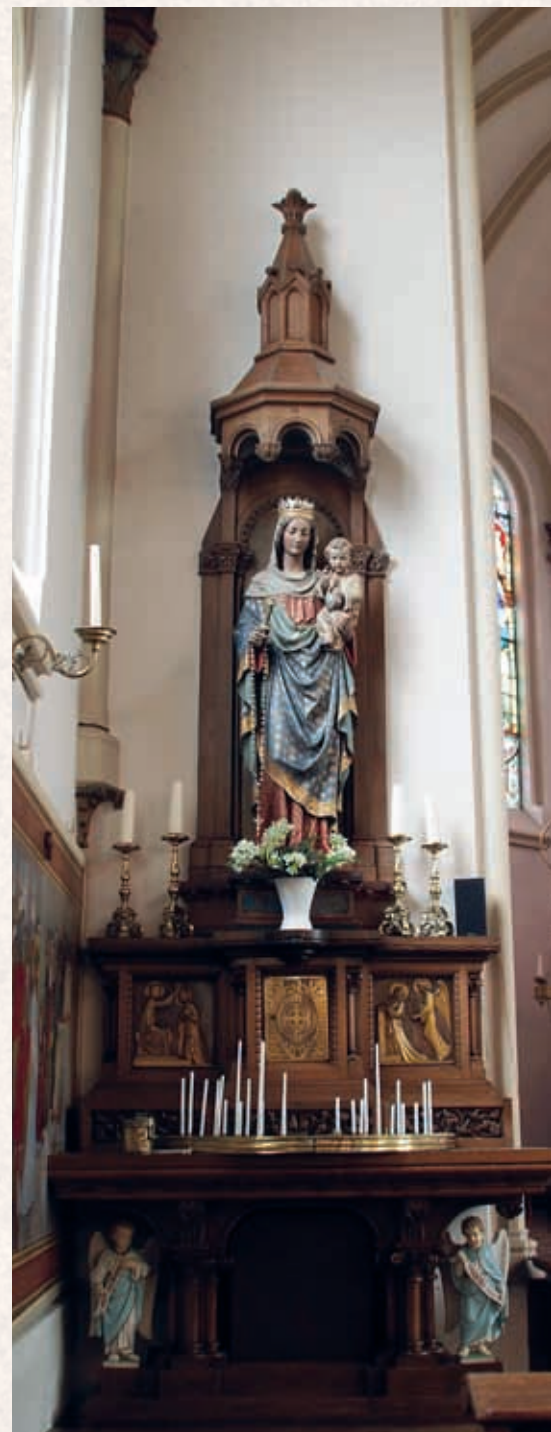
Het prachtige Maria-altaar in de Sint-Bavokerk.