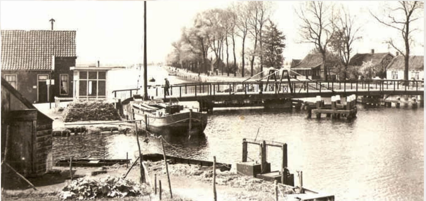
De oude draaibrug met in het midden de palingsbun.

gelmatig pissebedden rondliepen. Met water uit de Ringvaart werd de zaak schoongeboend. Een paar keer per jaar werd de beerput geleegd. Dat was goed voor de tuinderijen.